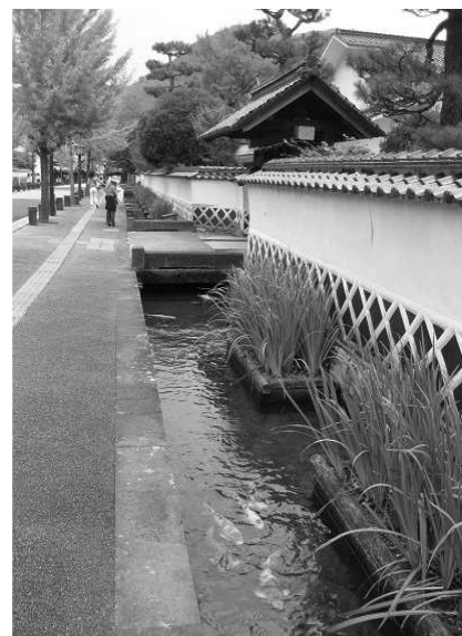
写真④ 鯉が泳ぐ白壁の古き街並み、 山陰の小京都。この町の名