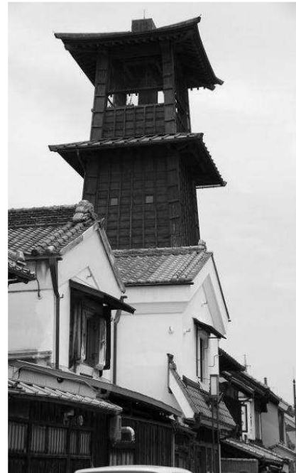
写真② 蔵造りの町並み、時の鐘、 小江戸。この町の名