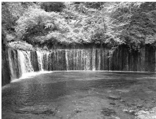
写真③ 軽井沢、浅間山の伏流水、 高さ3m巾70m。この滝の名