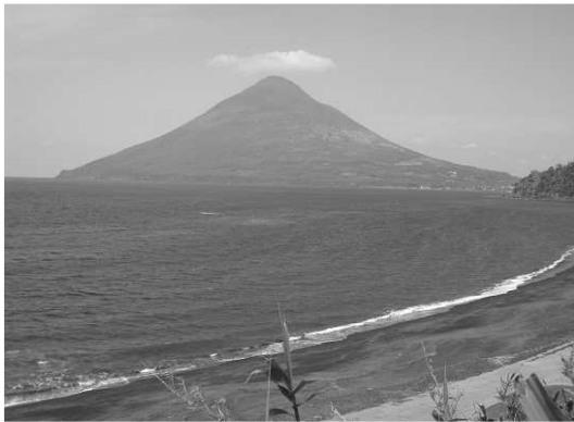
写真① 近くには池田湖や長崎鼻、 別名薩摩富士。この山の名