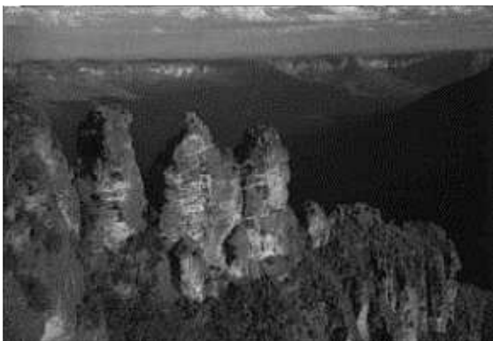
写真③ ユーカリの森、トロッコ列車、 三人姉妹。この国立公園の名