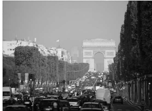
写真② マロニエの並木道、凱旋門、 コンコルド広場。この通りの名