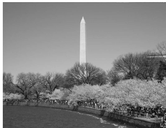
写真④ 日本の寄贈、桜並木、 桜まつり。この川の名