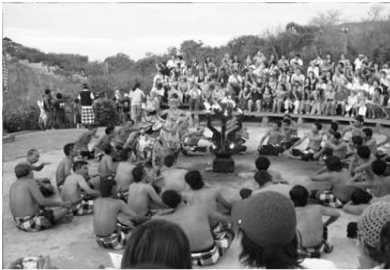
写真① 神々の島、ラーマーヤナ、 合唱舞踏劇、この踊りの名