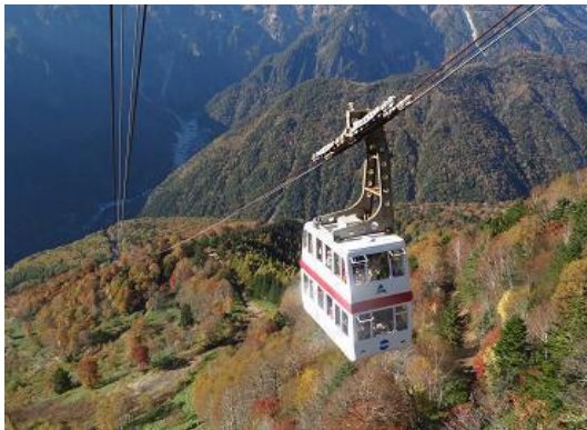
写真③ しらかば平、日本初の二階建て Gondola。 北アルプスにあるこのロープウェイの名