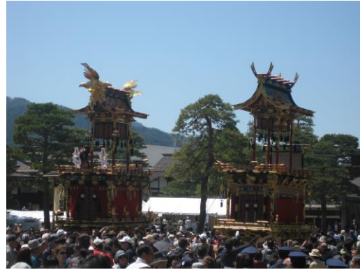
写真② 飛騨の小京都、豪華な屋台、山王祭と八幡祭。 動く陽明門と呼ばれるこの祭の総称名