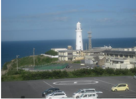
写真① 丸い水平線、日本初の回転式灯台。 銚子半島の東端にあるこの岬の名