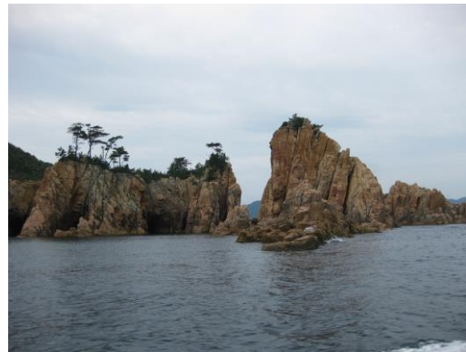
写真④ 日本海、国定公園、海上アルプス。 本土とは橋で連絡しているこの島の名