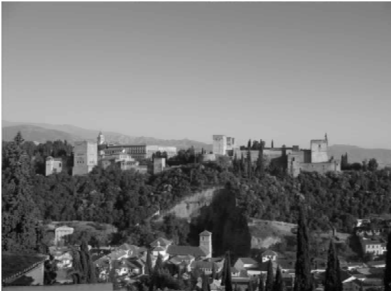
写真 ライオンの中庭、大使の間、 イスラム建築。この宮殿の名