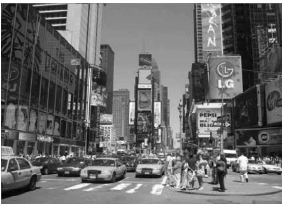
写真 ブロードウェイ、7番街、 世界の交差点。この広場の名