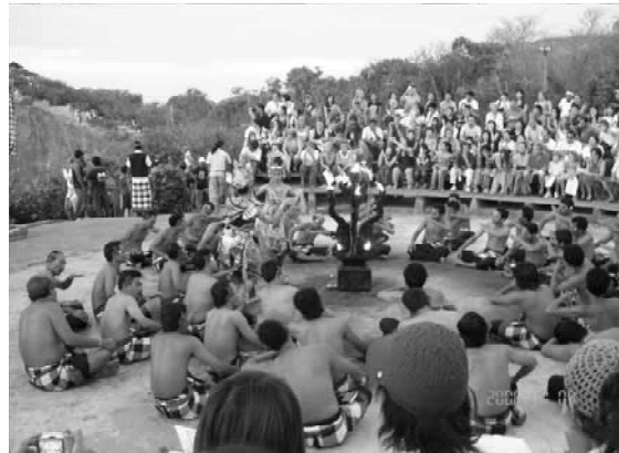
写真 舞踏劇、ラーマーヤナ、 バリ島。この踊りの名