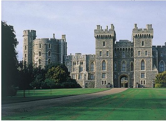
写真① テムズ川畔、エリザベス女王。 この城の名