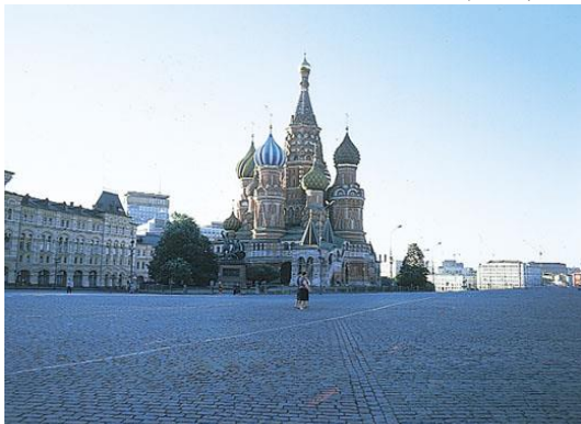
写真③ クレムリン、世界遺産。 この広場の名