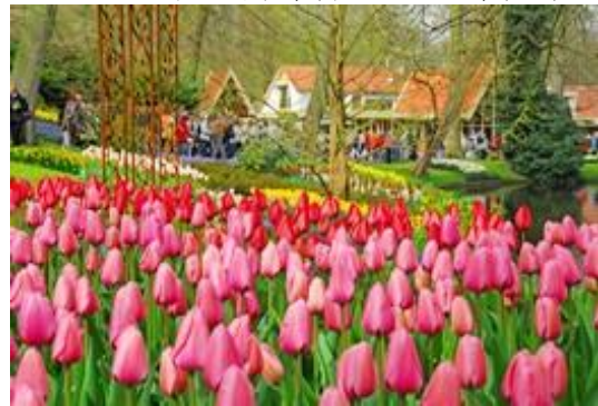
写真④ チューリップ、西欧の庭。 春のみ開園するこの公園の名