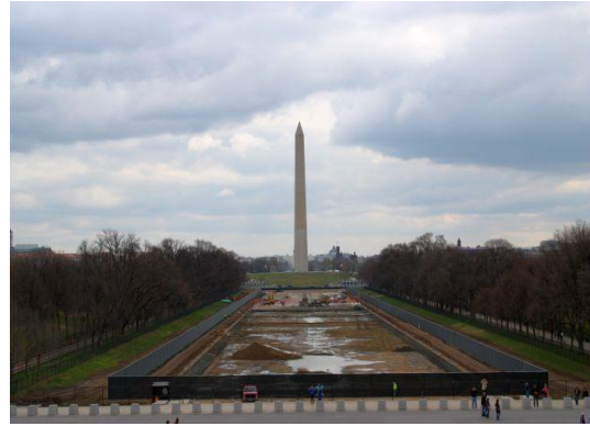
写真② 高さ 169m の石柱、 初代大統領。この記念塔の名