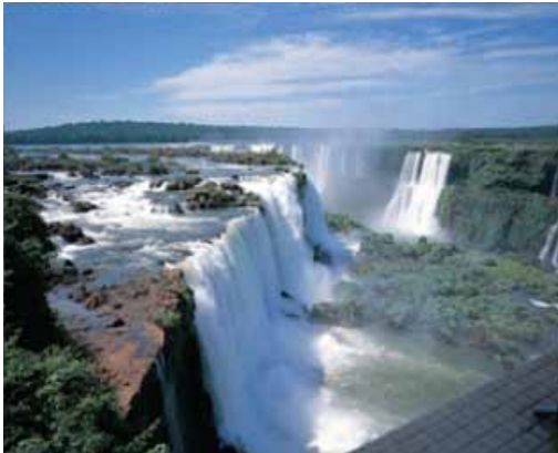
写真 悪魔の喉笛、世界三大瀑布。 南米にあるこの滝の名