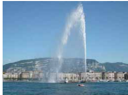
写真 三日月型の湖、IOC本部、 シヨン城。この湖の名