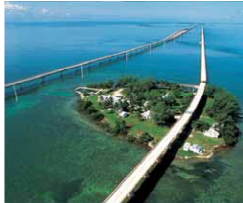
写真 フロリダ半島。キーウエスト この橋の名