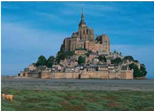
写真 聖ミカエルの山、巡礼地。 この修道院の名