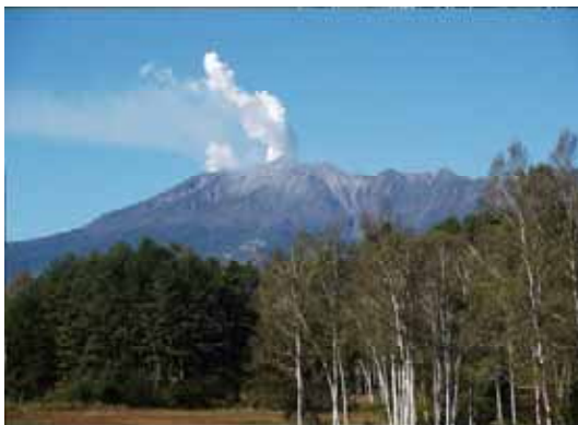
写真 日本百名山、木曾の 山。昨年噴火したこの山の名