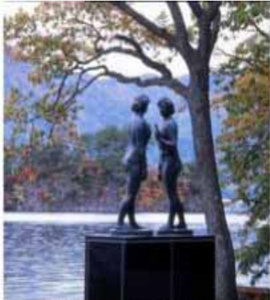
写真 高村光太郎、大町桂月、カルデラ湖。この湖の名