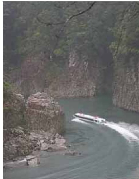
写真 吉野熊野国立公園、ウォータージェット船。この峡谷の名