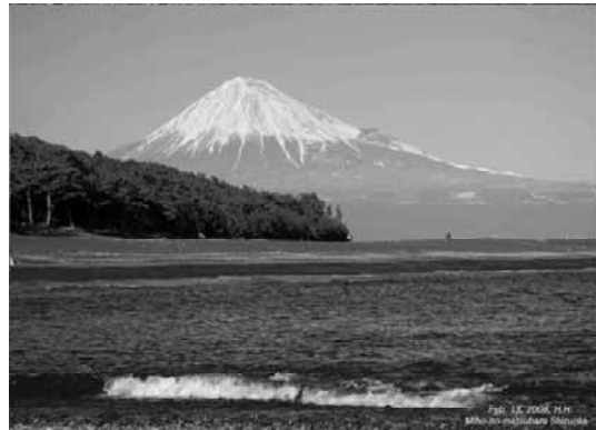
写真② 世界遺産、三大松原、 羽衣の松。この松原の名