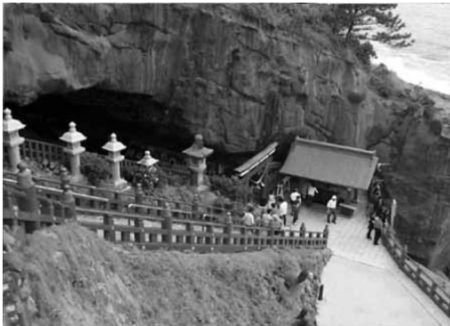
写真① 日向灘、海辺の断崖。 洞窟に祀られたこの神宮の名