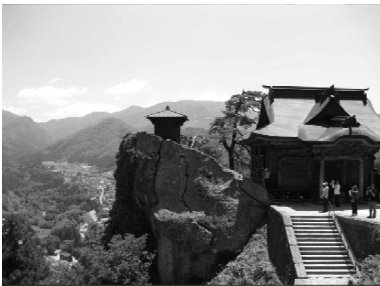
写真③ 松尾芭蕉、正式名称は立石寺。 閑かさや…。この寺の通称名