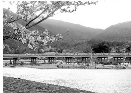
写真④ 桂川、桜と紅葉の名所、 この橋の名