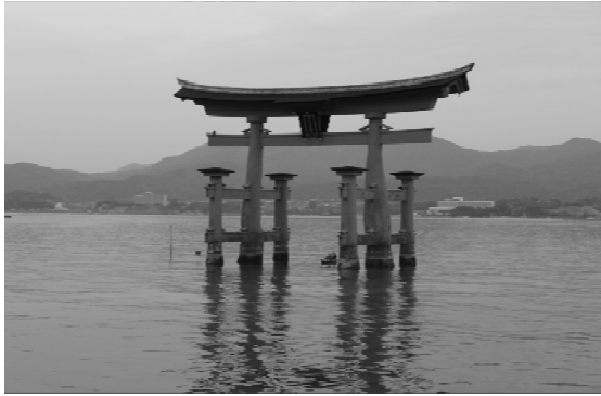
写真① 日本三景、平家の氏神、 世界遺産、この神社の名