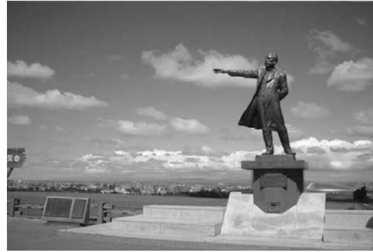
写真② 札幌農学校、少年よ大志を・・・ この像の人物名