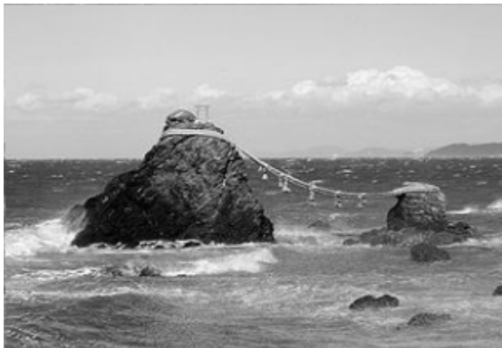
写真③ お伊勢さん、二見浦、 この大小2つの岩の名